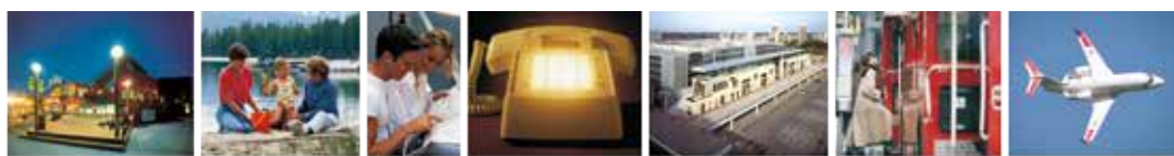
宁静夜晚 公园 一般谈话声 电话声 工厂 公车声 飞机声